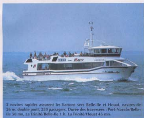
2 navires rapides assurent les liaisons vers Belle-Ile et Houat, navires de 26 m, double pont, 250 passagers. Durée des traversées : Port-Navalo/Belle-Ile 50 mn, La Trinité/Belle-Ile 1 h. La Trinité/Houat 45 mn.

Office de Tourisme Belle-Ile en Mer - Tél. 02 97 31 81 93