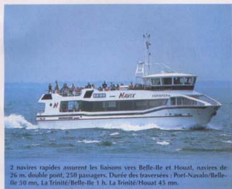
2 navires rapides assurent les liaisons vers Belle-Île et Houat, navires de 26 m, double pont, 250 passagers. Durée des traversées : Port-Navalo/Belle-Île 50 mn, La Trinité/Belle-Île 1 h. La Trinité/Houat 45 mn.

Office de Tourisme Belle-Île en Mer - Tél. 02 97 31 81 93